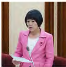
組み替え案の説明を説明するくれまつ議員

名古屋市長 2月定例会で提案された新年度予算案に対して日本共産党名古屋市議団は、予算の組み替えを求める動議を提出しました。