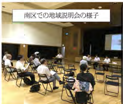
南区での地域説明会の様子

者からは「今回の 計画案は、小規模 校同士の統合では なく、近隣校との 統合もしくは小中 学校の併設で考え ている。例えば小 規模校の大磯小は 呼続小との統合も 有り得る」とし、 今後、全ての小規 模校ではないもの の、一定小規模校 の統合を進めたい との見解を示しま した。